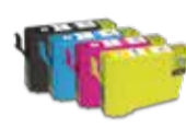
CARTUCCE ESAUSTE (TONER)