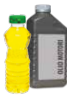
OLIO VEGETALE E OLIO MINERALE