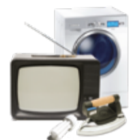
RAEE (Tutti i materiali elettrici ed elettronici)