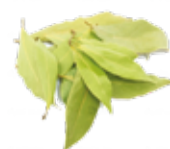
SFALCI E POTATURE