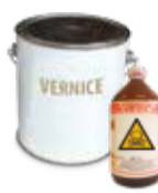
VERNICI, INCHIOSTRI ACIDI E PESTICIDI