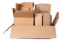
IMBALLAGGI IN CARTONE ONDULATO